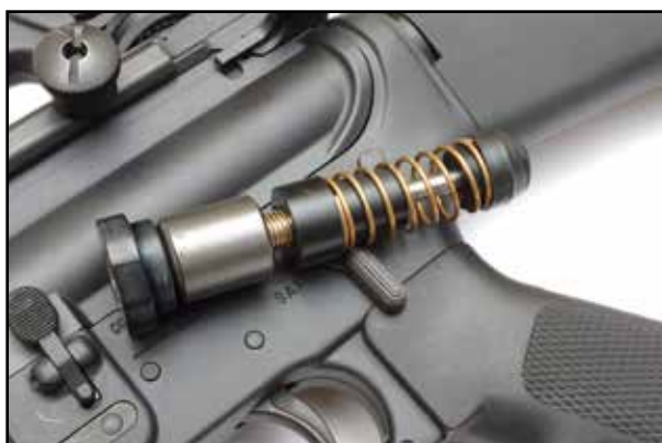
DPM AR-15 veerset

NUMMER 200 NEDERLAND € 7,45 BELGIE € 7,95